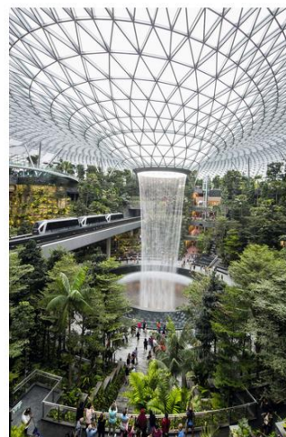
Jewel Changi, nouveau terminal de l'aéroport de Changi, inauguré le 17 avril 2019.

« Classement : les 10 meilleurs aéroports du monde en 2018 », Forbes.fr , 6 mai 2018